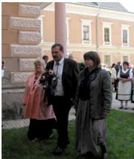
Am 25. April 2020 jährte es sich zum 75. Mal, dass aus den Komitaten Tolnau

und Branau ungarndeutsche Familien in der Früh geweckt und aus ihren Häusern verbannt wurden.