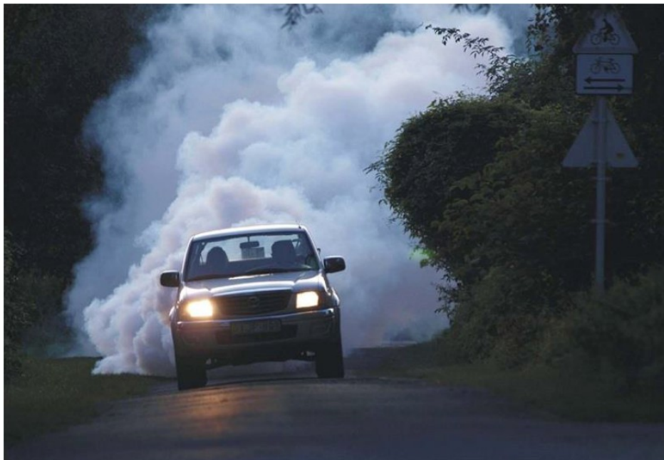
Melegköd-generátorral végzett szúnyoggyérítés

Kérjük, amennyiben figyelemmel szeretnék kísérni a tevékenységet, azt zárt ablakon keresztül tegyék!